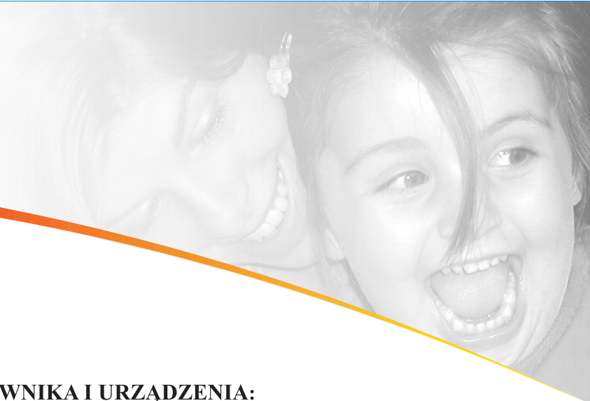
TABELA PARAMETRÓW UŻYTKOWNIKA I URZĄDZENIA: